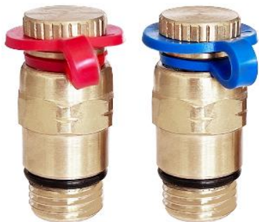
Рис. 2. Комплект ниппелей (пара) G1/4" для ручного балансировочного клапана.